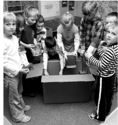
Natürlich wird es auch einen Tag der offenen Tür geben, und zwar am 25. September 2010. Dazu laden wir schon heute ganz herzlich ein. Kita „Spatzennest“ Porschendorf